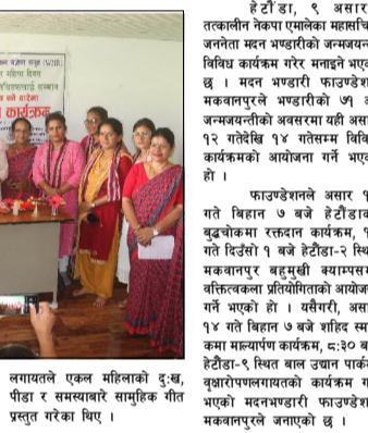
साझाकुरा संवाददाता हेटौडा, ९ असार/ तत्कालीन नेकपा एमालेका महासचिव जनता मदन भण्डारीको जन्मजयन्ती विविध कार्यक्रम गरेर मनाइने भएको छ । मदन भण्डारी फाउण्डेशन मकवानपुरले भण्डारीको ७१ औं जन्मजयन्तीको अवसरमा यही असार १२ गते विहवार १४ गते विहवार विविध कार्यक्रमको आयोजना गर्ने भएको हो । फाउण्डेशनले असार १२ गते विहवार ७ बजे हेटौडाको बुद्धचोकमा रक्तदान कार्यक्रम, १३ गते विहवार १ बजे हेटौडा-२ स्थित मकवानपुर बहुमुखी क्याम्पसमा विहवार विविध कार्यक्रमको आयोजना गर्ने भएको हो । यहीदिन, असार १४ गते विहवार ७ बजे शक्ति स्मारकमा कार्यक्रमको आयोजना गर्ने भएको हो ।