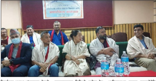
हेटौडा होटल व्यवसायीहरूले हेटौडा पर्वटक व्याजगत रातको १२ बजेसम्म होटल खोल्न सक्नेगरी माग राखेका छन् ।