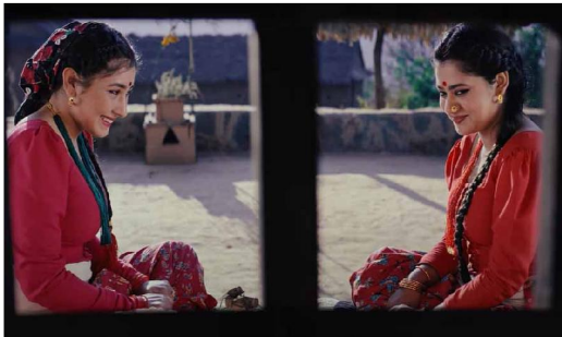
कमथ्याक सफल भएको महशुस गरिन्छ । यही अनिच्छी केही अधिकांशले बर्षौपछि हलमा परिवारसहित दर्शन फर्किने सुविधा मिलेको बताइन्छ । शर्माक प्रतिक्रिया राम्रो मिलेका कारण आगामी दिनमा पनि सिनेमाको राम्रो व्यापारको विश्वासलाई कायम राख्ने आशा व्यक्त गरिन्छ । अनिच्छी अर्थात् सिनेमाको दर्शनको राम्रो मान्द देखाउने ७ वर्षपछिको

आमा-सन्तानबीचको भावनात्मक कथा भनेका कारण विद्याभार मुभिजले ६५ वर्ष माथिका जेष्ठ आमाहरूको लागि सितैमा सिनेमा देखाउने घोषणा गरेको हो । निर्माण पछिले दिएको जानकारी अनुसार अन्तराष्ट्रिय फिल्मबर्स र शुभकामना हलले प्रदर्शन अवधिभन्दा जेष्ठ आमा-बुढा वृद्धलाई सितैमा सिनेमा देखाउने छन् । शुक्रबार औसत व्यापार गरेको भिगौदारले शांतिबाबुटा रफुलार सन्तोको थियो । शांतिबाबु अर्थात् हल हाउसफुल भएका थिए । शांतिबाबुदेखि पनि सिनेमाको टेन्ड राम्रो छ । बलियो 'बुँद अफ माइण्ड'ले सिनेमा लागेपछि तेस्रो घोडा बन्ने सकेन देखाएको छ ।