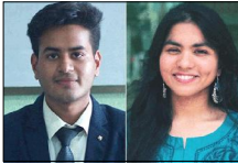
वर्षा सेटाइ/अमेश शाह

राजेश्वरको सोला किनारमा रहेको माभी बस्ती नेपाल आदिवासी जनजाति समुदायको सभामा प्रमुख हो । भौगोलिक रूपमा विशिष्टतापूर्ण नेपालको पूर्वदिशि पश्चिमसम्म विभिन्न आदिवासी तथा जनजातिहरूको बस्तीले सजिएका छन् । कुन जनसंख्याको ३५.८ प्रतिशत आदिवासी जनजाति छन् । नेपालले ५९ वटा वस्ता समुदायलाई कानुनी मान्यता दिएको छ । सामान्यतः आदिवासी जनजातिका धेरै समुदाय सीमानन्त र बहुकरुणामा परेका छन् ।