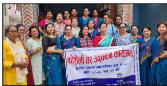
साझाकुरा संवाददाता हेटौडा, २२ भदौ/ महिलाहरूले उत्पादन गरेको सामग्री बजारीकरण गर्न कोशेली घर सञ्चालनमा आएको छ।

कोशेली घर सञ्चालनमा ल्याइएको बताइएको छ। कोशेली घरको अध्यक्षतामा रहेको कोशेली घर सञ्चालनमा आएको छ।