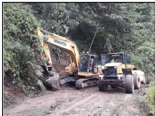
भीमफेदी गाउँपालिका वडा नम्बर ८ मा बन्ने अखिल नेपाल खेलकूद महासंघको स्थायी कार्यालयको निर्माण कार्य अग्रेसरमा अगाडि बढेको छ।