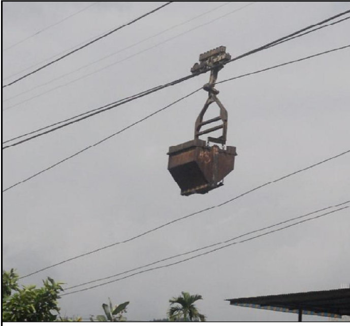
१६ वर्षेपछि रोकिएको रोप-वे: हेटौडाबाट भीमफेदी गाउँपालिकाको भैसेखानीसम्म तारमा बेवारिसे अवस्थामा फण्डिङका रोप-वेका डिब्बाहरू देखा सकिन्छ। पूर्वपश्चिम राजमार्ग हुँदै हेटौडा आउनेले पनि हेटौडा-१० रानी किनारनजिकै तारमा फण्डिङका डिब्बाहरू देखा सकिन्छ। ती डिब्बा त्यसरी फण्डिङको ३६ वर्ष भयो। करिब २० वर्ष ती डिब्बा हेटौडा सिमेन्ट उद्योगको लागि चन्द्रगंगा ओसार्ने प्रयोग भए पनि ६२ सालदेखि भने पूर्णरूपमा बन्द छ। फण्डिङका कतिपय डिब्बाका अर्भे पनि हुनाहरू भएपछि उनीहरूको देखा सकिन्छ। ४ वर्षेपछि घाटमा रहेको सरकारी स्वामित्वको हेटौडा सिमेन्ट उद्योगले उक्त रोप-वे विक्री नयाँ प्रविधि मिथ्याउने तयारी गरेको छ।