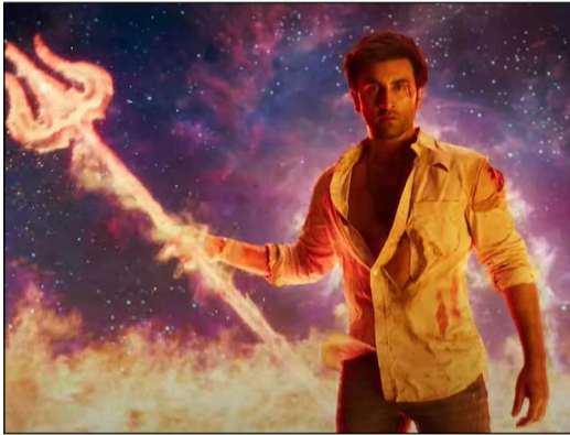
जुन थियो, 'समेरा', 'पृथ्वीराज', 'भिलेन रिटर्न्स' जस्ता बलिउड फिल्महरू नराजोसँग चल्दै आए । बलियो स्टार काण्ट, लोकप्रिय गीत-संगीतका कारण 'ब्रम्हास्त्र'लाई सफलता ओपनिङ मिलेको हो ।

यो फिल्मभन्दा अगाडि अक्षय कुमारको 'सूर्यवंशी', अलिया भट्टको 'गंगुबाई काठियावाडी' र कार्तिक आर्यनको 'भूल भुलैया २'ले पनि भारतीय बक्सअफिसमा सुबह कमाई गरेका थिए । तर, 'जुन