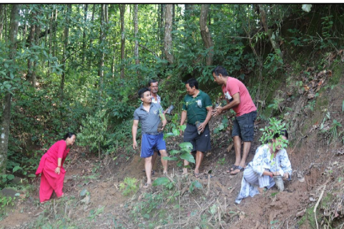
हेटौडा उपमहानगरपालिका-२ स्थित, घोसीकुवा संरक्षणमा जुटेका स्थानीय । स्थानीय जंगलमा घोसीकुवा संरक्षणका लागि स्थानीयहरूले विभिन्न विद्या रोपेका छन् । स्थानीयहरू घोसी कुवा संरक्षण समिति नै बनाएर उदाहरणीय कार्यका लागि अग्रसर बनेको भन्दै जनप्रतिनिधिहरूले सुशी व्यक्त गरेका छन् ।