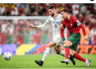
फर्नांडेजले २-० को जितसहित पोर्चुगललाई एक खेल अगावै समूह चरण पार पारे । पोर्चुगल चार वर्षअघि यही दक्षिण अमेरिकी युलुकसँग पराजित हुँदा अन्तिम १६ बाटै बाहिरिएको थियो । सन् २०१८ को रूस विश्वकपमा एडिन्सन क्यामानीको दुई गोलको मद्दतमा उरुग्वे २-१ को नतिजामा पोर्चुगललाई पराजित गर्दै क्वाटरफाइनलमा स्थान बनाएको थियो । सोही पराजयको बदला

काठमाडौं / बु. नो फर्नांडेजको दुई गोलसहित पोर्चुगल समूह 'ए'मा उरुग्वेलाई २-० को नतिजामा पराजित गर्दै फिफा विश्वकपको फि-क्वाटरफाइनलमा पुगेको छ । लुसेल रंगशालामा सम्पन्न खेलको ५४औं मिनेटमा फर्नांडेजले गरेको गोलसँगै पोर्चुगलले अग्रता लिएको थियो । पहिलो हाफ गोलसहित भए पनि दोस्रो हाफमा पोर्चुगलले दुई गोल गर्दै सुक्याती दुई खेलबाट ३ अंकसहित अन्तिम १६ को यात्रा तय गर्छ । विश्वकप अन्तिम अन्तिम मिनेटमा उरुग्वेका जोसे मारिया गिभिनले पेनाल्टी फ्रियामा ह्याण्ड गरेपछि जित सुनिश्चित गर्ने मौका पाएको थियो । सोही पेनाल्टीमा यही दक्षिण अमेरिकी युलुकसँग पराजित हुँदा अन्तिम १६ बाटै पोर्चुगलका लागि दोस्रो गोल गर्दै