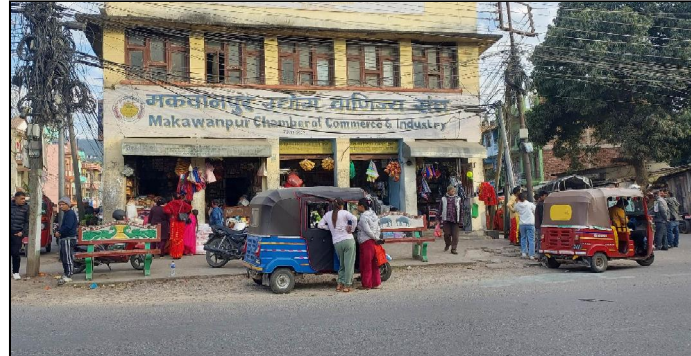
मकवानपुर उद्योग वाणिज्य संघ चोकमा बजारको मुख्य सडकमै रोकिराखेका अटो । धेरै व्यस्त रहने संघ अगाडिको चोकमा यसरी अटो रोक्न ट्रफिक नियम विरुद्ध हुन आउँछ तर, प्रहरीकै अगाडि अटोहरूले यात्रु चढाउने र ओरान्ने काम गरिरहेका छन् । प्रतिघात भन्ने अटो रोक्न घुर्घटनाको जोखिम बढ्नुका साथै ट्रफिक व्यवस्थापनमा समस्या देखिएको छ । संघ चोकमै खटिएका ट्रफिक प्रहरीले समेत सडकमै रोक्ने अटोहरूलाई कुनै कारवाही गरेको पाइँदैन । अटो व्यवसायीहरूले ट्रफिक प्रहरीको आँखा छुन अटो स्टाम्पे रोक्ने गरेको देखाउने गरेकोको स्थानीय प्रत्यक्षदर्शीले जानकारी दिए ।