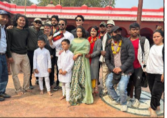
'भगवत् गीता'को छायांकन सुरु भएको छ ।

काठमाडौं/सामो र साकस्लीपछि अन्तःक्रिया बापको चौथो निर्देशक फिल्म 'भगवत् गीता'को छायांकन सुरु भएको छ ।