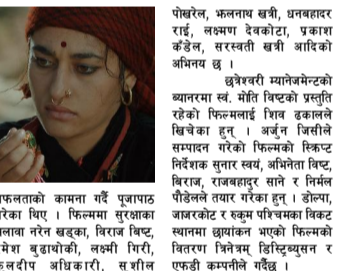
'बुलाकी'को टिजर सार्वजनिक भएको छ ।

काठमाडौं/२०२० सालको बैशाख १ गते (तयारी वर्ष) बाट प्रदर्शनमा आउन लागेको फिल्म 'बुलाकी'को टिजर सार्वजनिक भएको छ ।