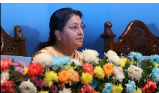
राष्ट्रपति विद्यादेवी भण्डारीले संसदलाई सम्बोधन गर्दै गर्दा।

काठमाडौं/७ वर्ष साभो कार्यकाल सकेर शीतल निवास छाड्नुअघि राष्ट्रपति विद्यादेवी भण्डारीले शुक्रबार मध्याह्न संसदको संयुक्त बैठकलाई सम्बोधन गरिन् । २९ फागुन २०७२ मा राष्ट्रपति पदसिद्धि भएकी भण्डारीको संघीय संसदलाई राष्ट्रपतिको रूपमा यो नै अन्तिम सम्बोधन हो ।