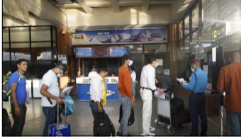
यसो निर्णय लिएको बताइएको छ ।

मन्त्रालयका अनुसार यस अनुसार वैश्विक रोजगारीमा दुई वर्षे प्रावधान राख्दा कामदारको कार्य अवधि र प्रिमा अवधि छुट्टै श्रम स्वीकृति लिनु बाहेक नै नेपाल आउनु पर्ने बाध्यता हुनेछ । विदेशमा रकम भन्दा पनि आफ्नो मुलुकले दिएको श्रम स्वीकृतिको अवधि नपाई बलु पर्ने अवस्थाले बढी फलामा कामदार फले गरेको गुनासोपछि सरकारले