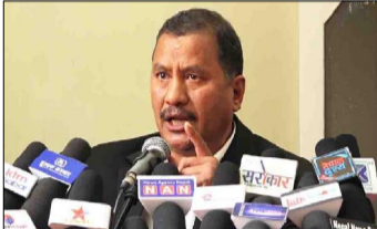
विप्लवको रिट निवेदन दर्ता गर्ने अदेश दिएपछि माओवादी घटकहरूले विरोध गरिरहेका छन् ।

काठमाडौं / सर्वाे चर्च अदालतले प्रधानमन्त्री तथा माओवादी केन्द्र अध्यक्ष पृथ्वीमान दाहाल प्रचण्ड विप्लवको रिट निवेदन दर्ता गर्ने अदेश दिएपछि माओवादी घटकहरूले विरोध गरिरहेका छन् । राजनीतिक प्रतिवादहरूकै बीचै सधैँ संघम गुमाएर बाँसिरहेका छन् नेत्रत्रयक्रम चन्द्र विप्लव । एक साताअघि उनले आफूहरूसँगै बोलेनाई 'डेगान सहायिने' धम्की दिएका थिए । त्यसको अर्को दिन उनले 'यशस्व हिताको इतिहास शोभेप्यार्थ' धम्की फेरि दिए । बुधबार माओवादी युद्धबारे बोल्नुअघि 'आफ्नो जीवनको ख्याल गर्न' भन्दै ज्यानको धम्की दिएका छन् ।