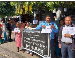
कार्यालयबाट हिंडेकोमा उनले आफ्नै निर्णय कार्यालयन गरेका थिएन्न्। प्रहरी कार्यालयमा गरेको भौतिक सहमति पावना नगरेपछि पीडित सुनार बुद्धचोकमा बस्नार बोकेर साडे ४ महिनादेखि अनवरत धर्नामा थिए। सुहातामा एकै ठाउँ सुरु गरेका छन् भने ८ महिना अघि जिल्ला अदालतमा शाक्यविरुद्ध जलसाडीको मुद्दा दावस्तमेत गरेका थिए। हाल मुद्दा विचारधीन छ। जिल्ला प्रहरी कार्यालयमा शाक्यले जग्गा फिर्ता गर्ने सम्बन्धमा सहमति नगरेको र २१ गतेसम्म एउटा निर्णय दिने सहमति गरेको पीडित सुनारले बताए।

प्रहरीमा करिब ४ महिना अघि सुनार र शाक्यबीच र्मिहम सहमति नै भएको थियो। त्यतिबेला शाक्यले सुनारलाई जग्गा फिर्ता गरि दिने भौतिक सहमति गरेर प्रहरी