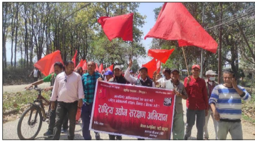
नेकपा बहुमतले हेटौडा कपडा उद्योग पुनः संचालनमा ल्याउन माग गर्दै प्रदर्शन गरेको छ ।

साझाकुरा संवाददाता हेटौडा, २१ चैत / नेकपा बहुमत मकवानपुरले हेटौडा कपडा उद्योग पुनः संचालनमा ल्याउन माग गर्दै प्रदर्शन गरेको छ । अर्थात् दशकदेखि बन्द गरेको हेटौडा कपडा उद्योग संचालनमा ल्याउन माग गर्दै प्रदर्शन गरिएको हो । मंगलबार दिउँसो पार्टीको 'आत्मनिर्भर अर्थव्यवस्थाको जग बडा गरी, राष्ट्रिय उद्योगको संरक्षण, विकास र विस्तार गरी भने राष्ट्रिय उद्योग संरक्षण अभियान अन्तर्गत हेटौडास्थित कपडा उद्योगमा प्रदर्शन गर्दै उद्योग संचालन र संरक्षण गर्न माग गरेको बताइएको छ । हेटौडाको कपडा उद्योग तत्कालीन अवस्थामा अत्याधुनिक प्रविधिको थियो । एउटै छानामुनी एकैजसो जनाले रोजगारी पाएका थिए । एउटै उद्योगमा एकैतिरबाट कपडा हल्लेपछि अर्कोतिरबाट तयारी कपडा निस्कन्थ्यो । धागो बन्दैरहेथि भएर कपडा बनेर त्यसलाई कवर फुल बनाएर निकाल्ने एकमात्र उद्योग थियो हेटौडा कपडा उद्योग । हेटौडा कपडा उद्योगको उत्पादन गुणस्तरिय भएका कारण विदेशीको विचलन पोशाकदेखि भएदुर, किसान, कर्मचारी, व्यापारी सबैले मनपराएका थिए । २०२६ मा कपडा उद्योग 'सटडाउन' गराउने कार्यको विरुद्धमा राजनीतिक