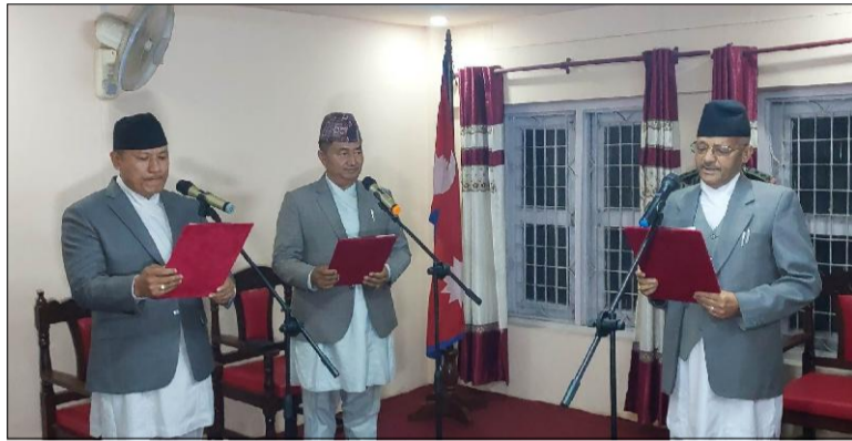
नेता लामालाई नेता व्यवस्थापनमा चुनौती थियो ।

भागवण्डाको टुंगो लाग्न बाँकी हुँदै सरकारमा सहभागी भएको नवनिर्वाचित आर्थिक मामिला तथा योजना मन्त्री लामाले स्वीकारे । सपथ गृहणपछि धारणा राख्दै लामाले भागवण्डामा अन्तिम सहमति हुन बाँकी रहेको बताए । कांग्रेसले कति मन्त्रालय लिने भन्ने सम्बन्धमा छलफल जारी नै रहेको लामाले बताए । कांग्रेसबाट दुईजनाको सपथ सुट्नुक भएको पार्टीभित्र आरोप छ भन्ने पत्रकारहरूको प्रश्नमा लामाले सुट्नुक सपथ नलिएको र सूचना दिएको दाबी गरे । कांग्रेसबाट थप मन्त्रीहरूको नियुक्ति सहकार्यबाट तय हुने उनको भनाई छ । कांग्रेसमा मन्त्रीका आकांक्षी धेरै भएपछि दलका