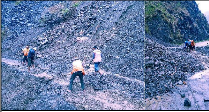
हेटौंडा-कठमाडौं जोडने झोटे मार्गवर्तगत कुलेखी-विसेले हाडमा सकेको पहरो पन्छाउँदै विभिन्न सडक हेटौंडाका कर्मचारी र स्थानीय। विगत केही दिनेदिने पछिरेको बर्बाद करण सिलेरी-कुलेखी सडक हाडमा साना पहिरो गएका छन्। पानीमै विजेर पहिरो पन्छाउने काम बढेको खानीय रोशन टुम्किने जानकारी दिइएको छ। पहिरो गएर सडक अवरुद्ध हुँदा यात्रुहरू अनपन्न परेका छन्। किल्ला सिलेरी सडक हाड हेटौंडा-कठमाडौं अर्बनबाह्रका लागि धेरै प्रयोग हुने गरेको थियो। करिव २ वरिष्ठ सडक निर्माण जारी रहेकाले सवारीसाधनहरू फलेकले यात्रा बढी गइरहेछ।