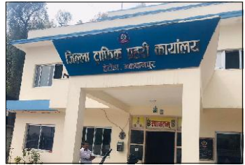
परेको ट्राफिक कार्यालयको तथ्यांक छ। साउन्सलर वित्त मन्त्रालयमा सवारीसाधन कारवाहीबाट २ करोड ४५ लाख ८९ हजार ५३ सय ९१को कारवाही गर्दा सरकारको ढुक्कीमा २ करोड ५५ लाख ८९ हजार ५३ सय ९१को राखेर संकलन गरेको किल्ला ट्राफिक प्रहरी कार्यालय मकवानपुरका प्रमुख जिल्ला ट्राफिक प्रहरी कार्यालयले जानकारी दिएको छ। कार्यालयका अनुसार चालू आर्थिक वर्ष २०७९/८० को ९ महिनामा सवारीसाधन कारवाही गर्दा ३२ हजार ५३ सय ९१को कारवाही गरिएको छ।

साझापुरा संवाददाता हेटौंडा, २१ वैशाख/ मकवानपुरमा चालू आर्थिक वर्ष २०७९/८० को ९ महिनामा कम्पन उल्लंघन गरी सञ्चालन गर्ने ३२ हजार बढी सवारीसाधन कारवाहीमा परेका छन्।