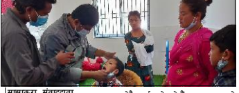
साझापुरा संवाददाता हेटौंडा, २१ वैशाख/ जिल्लाको विक्ट कैंलाश गाउँपालिका वडा नम्बर २ फिवा गोलेने चौकबाट सञ्चालित शिविर भएको छ।

कठमाडौं, २१ वैशाख/ काठमाडौं महानगरपालिकाका नगर प्रहरीहरू कार्यलयमै तास खेल्ने गरेको पाइएको छ। टुम्कि नगर प्रहरी बलको कार्यालयमा नगर प्रहरीको पोसाकमा तास खेल्ने गरेको तस्वीर सार्वजनिक भएको छ।