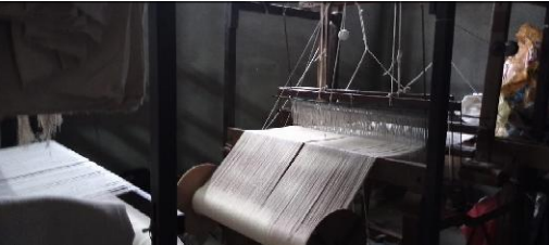
अर्थिक सहयोग तथा याहा नगर नमु उद्यम विकास कार्यक्रमअन्तर्गत अल्लो धागोको ४५ दिने कपडा बुनाई तथा सिवाई तल्लिम विहीवार समापन गरिएको छ। ४५ दिनसम्म गोपाली गाउँका १० जनालाई कपडा बुनाउन सिकाइएको हो। १० जना सहभागी तल्लिमबाट कपडा बुनाई तर्फको चर्चा युवाउन, टुम्किमा धागो भर्ने, तास गाड्नु, कोका-कोपी भर्ने, पाउरोटीनी बुनाउने, बट्टा बुनाउन सिकाइएको थियो।

साझापुरा संवाददाता हेटौंडा, २१ वैशाख/ जिल्लाको उत्तरी क्षेत्रीय तथा नगर पालिकाको गोपाली गाउँका स्थानीय महिलाहरूलाई अल्लोको कपडा बुन्न सिकाइएको छ।