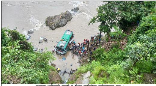
बुधबार धादिङको गजुरी-२ स्थित चालिसैमा दुर्घटनाग्रस्त बस।

काठमाडौं/ बुधबार विहान काठमाडौंबाट पर्वतको लागि छुट्टैको प्रदेश ०१-००५ ख १९१२ नम्बरको बस धादिङको गजुरी गाउँपालिका २ चालिसैविठ त्रिशुली नदीमा खडा ८ जनाको मृत्यु भयो। दुर्घटनाको कारण भने खुलेको छैन।