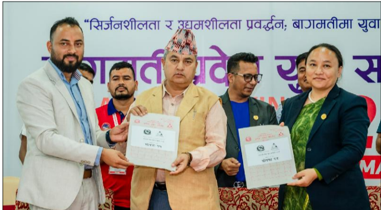
“सिर्जनशीलता र उद्यमशीलता प्रवर्द्धन; बागमतीमा युवा विकासका लागि आवश्यक नीतिगत सम्बोधन र प्रभावकारी कार्यान्वयन गर्न माग गरिएको छ।

प्रविष्टीमा पहुँच, क्षमता विकास, सीप विकास, युवाले नेतृत्व गरेका संस्थाको संस्थागत सवलीकरण, संजालीकरण र युवाका साक्षात्कारको सम्बोधन लगायत सवालमा परिषद् तथा जिल्ला युवा समिति र स्थानीय तहको समेत थप क्रियाशील बनाउन माग गरिएको छ। बागमती प्रदेश युवा परिषद् ऐन २०७६, नियमावली २०७७, प्रदेश युवा नीति २०७९ को प्रभावकारी कार्यान्वयन गर्दै बागमती प्रदेशका युवाको चाहना र आवश्यकताको सम्बोधन गरिनुपर्ने, कला, संस्कृति, पुरातत्व र ऐतिहासिक तथा प्राकृतिक क्षेत्रको पहिचान, अभिलेखीकरण, संरक्षण र प्रवर्द्धनमा युवाको सहभागिता सुनिश्चित गर्न माग गरिएको छ।