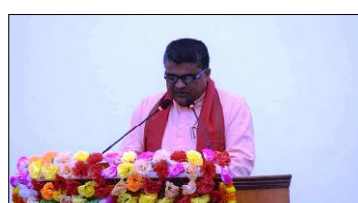
गरेको छ ।

मधेश सरकारले आगामी आर्थिक वर्ष २०६१/८२ को लागि ४३ अर्ब ८९ करोड २१ लाख ७० हजार सैवाको बजेट ल्याएको छ ।