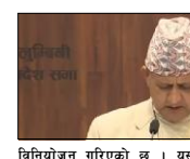
विनियोजन गरिएको छ ।

लुम्बिनी सरकारले आर्थिक वर्ष २०६१/८२ को लागि ३८ अर्ब ९५ करोड ९५ लाख ३२ हजार सैवाको बजेट प्रेश भागमा प्रस्तुत गरेको छ ।