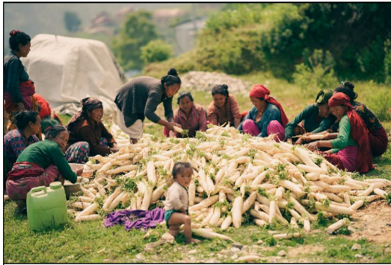
बजारमा मुला विक्रीका लागि लैजाने तयारी गर्दै बाहानगरका तरकारी किसान ।