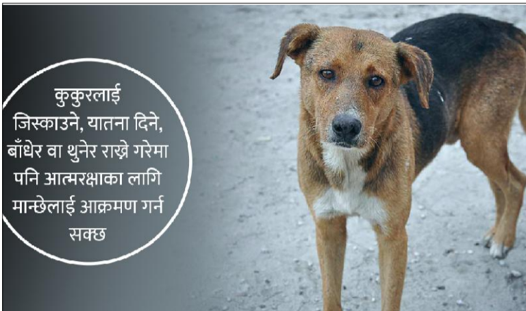
कुकुरलाई जिस्काउने, यातना दिने, बाँधेर वा थुनेर राख्ने गरेमा पनि आत्मरक्षाका लागि मान्छेलाई आक्रमण गर्न सक्छ

'अधिकांश मानिस कुकुरले टोकेपछि निजी क्लिनिकमा टिटेनसको सुई लगाएर म दुबक छु भन्ने गरेका छन्,' डा. पुनले भने, 'तर त्यस्ता व्यक्तिमा दुई-तीन