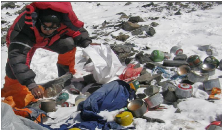
हस्तान्तरण गर्नुपर्ने भन्दै सगरमाथालाई स्वच्छ राख्न कदमहरू चाल्न सुरु भएको थियो ।

काठमाडौं / नेपाली सेनाले पर्यावरण संरक्षणका लागि भन्दै वन तथा वातावरण मन्त्रालयको समन्वयमा वर्षेन हिमाल सरसफाइ अभियान चलाउँदै आएको थियो । तर, यसपालि आरोहणको सिजन सुरु भइसक्दा सरसफाइ अभियानको कुनै सुरसार छैन । सिजनको पहिलो आरोहणका लागि अहिले शोर्पाहरूले बाटो बनाउने कामलाई तिब्रता दिइरहेका छन् । तर, सरसफाइ अभियानका लागि कुनै पूर्वतयारी थालिएको छैन ।