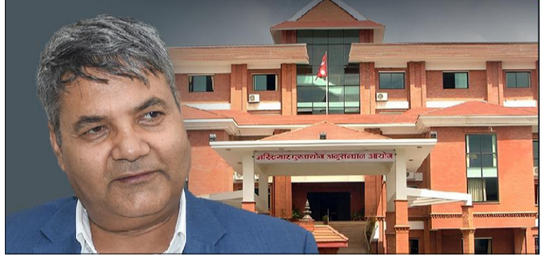
बनेपास्थित आईटी पार्कमा स्थापना हुने सेक्युरिटी प्रिन्टिङ प्रेस खरिद गरेमा प्राप्त हुने कमिसनबारे कुराकानी गर्दाको अडियो रेकर्ड C फागुन, २०७६ मा सार्वजनिक भएपछि प्रधानमन्त्री केपी ओलीको अधिल्लो कार्यकालका प्रभावशाली मन्त्री बास्कोटाले राजीनामा दिएका थिए ।