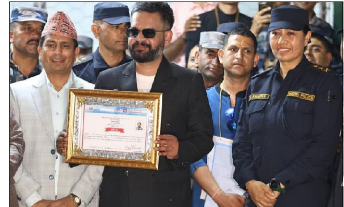
निर्वाचनको अन्तिम नतिजा सार्वजनिक भइरहेका बेला नेपाली राजनीतिमा एउटा महाकाव्यको अन्त्य र नयाँ युगको सुरुवात भएको छ । भापाको त्यो गड, जहाँ ओलीले राज्यकोषको अबै रकम खन्याएर विकासका नाममा आफ्नो वर्चस्व जोगाउने प्रयत्न गरेका थिए । त्यहाँ बालेनले ४९ हजार ६ सय १४ मतको विशाल मतान्तरले विजय हासिल गरे । ६८ हजार ३ सय ४८ मतका साथ बालेन विजयी हुँदा ओली केवल १८ हजार ७ सय ३४ मतमा खुमिचन पुगे । यो केवल एक व्यक्तिको हार वा जित थिएन, नेपाली राजनीतिमा रहेको सामन्ती सोच, दम्भ र पुरानो पुस्ताको एकाधिकार माथिको निर्मम प्रहार थियो । भापाका युवाहरूले ओलीले दमकमा निर्माण गरेका गगनचुम्बी भ्यूटारभन्दा बालेनको आँखाभन्दा भल्केको सुशासनको सपनालाई विश्वास गरे ।

भापा-५ केवल एउटा निर्वाचन क्षेत्र मात्र थिएन, त्यो त एउटा राजनीतिक विरासत र शक्तिको प्रतीक थियो । २०४८ सालदेखि नै अपवादबहेक निरन्तर विजयी हुँदै आएका र विपक्षीलाई लज्जास्पद हारको स्वाद चखाउँदै आएका एमाले अध्यक्ष केपी शर्मा ओलीका लागि यो क्षेत्र एउटा सुरक्षित कवचजस्तै थियो । तर यसपटक इतिहासले आफ्नो पाना फटाउने निर्णय गरिसकेको थियो । बालेनले जब 'शपटी' चिह्न लिएर भापाको माटोमा पाइला टेके, तब त्यहाँ परिवर्तनको लहर चल्‍यो । धेरैले बालेनलाई 'राजनीतिक आत्महत्या' भनेर टिप्पणी गरे, तर ती टिप्पणीकारहरूले युवा पुस्ताको मनमा उम्लिरहेको विद्रोहको लामालाई ठम्याउन सकेका थिएनन् ।