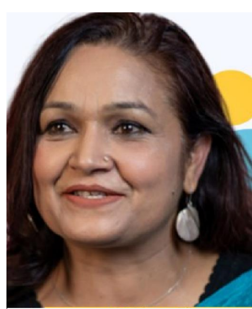
मनोबल गिराएको छ । महासंघले अब आन्दोलनको तयारी गर्छ । जिल्ला-जिल्लाबाट सञ्चार कर्मिहरूले विरोध जनाइरहेका छन् । पत्रकार महासंघ यो निर्णय नसच्चिपसम्म देशव्यापी आन्दोलनमा उत्रिन्छ । महासंघले चाँडै बैठक बसी आन्दोलनका थप कार्यक्रम सार्वजनिक गर्ने तयारी गरिरहेको छ ।

नै संकटमा पर्छ । यो संघीयता र संविधानको उल्लंघन पनि हो । संविधानअनुसार स्थानीय र प्रदेश सरकारहरू स्वायत्त छन् । उनीहरूलाई आफ्नै नीतिअनुसार सञ्चारमाध्यमको व्यवस्थापन र सहकार्य गर्ने अधिकार छ । तर, संघीय सरकारको मन्त्रिपरिषद्ले केन्द्रबाटै ती नै तह (संघ, प्रदेश र स्थानीय) को विज्ञापन रोक्ने निर्णय गर्नुले संघीयताको मर्म र संविधानप्रदत्त अधिकारको ठाडो उल्लंघन हो । प्रेस स्वतन्त्रता र स्वनिर्णयको जोखिम पनि बढाएको छ । निजी सञ्चारमाध्यमले सरकारलाई प्रश्न गर्ने र सचेत गराउने भूमिका निर्वाह गर्छन् । विज्ञापन रोकेर आर्थिक नाकाबन्दी लगाउनुले मिडियामा 'सेल्फ सेन्सरशिप' बढ्ने र यसले लोकतन्त्रको चौथो अंगलाई कमजोर बनाउने देखिन्छ । सञ्चार मन्त्रीले सरोकारवालाहरूसँग छलफल गर्ने आश्वासन दिए पनि कुनै संवाद भएको छैन । यसले लोकतन्त्रको चौथो अंगलाई कमजोर बनाउने देखिन्छ । सञ्चार मन्त्रीले सरोकारवालाहरूसँग छलफल गर्ने आश्वासन दिए पनि कुनै संवाद भएको छैन । यसले लोकतन्त्रको चौथो अंगलाई कमजोर बनाउने देखिन्छ ।