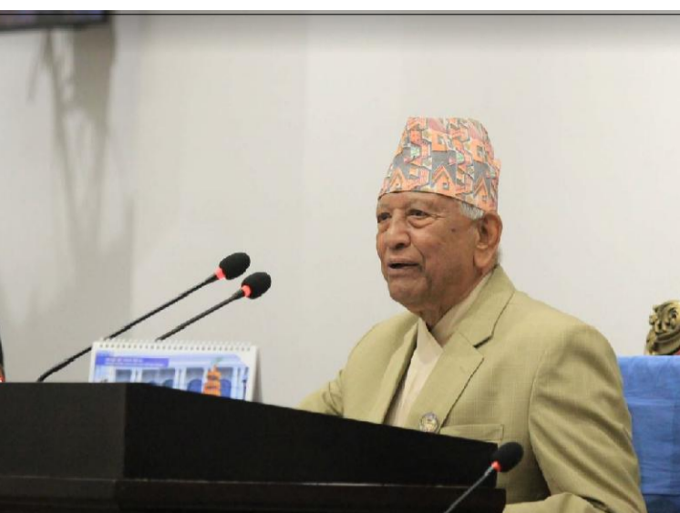
संसद् सभसँग पेस गरेका थिए । त्यसपछि केही शोक प्रस्ताव पास गरेर अर्को बैठक चैत २२ गते बस्नेगरी सक्तियो ।