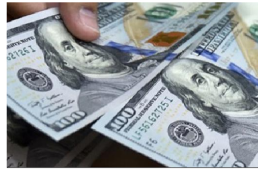
लिनेको संख्या २ लाख ४१ हजार ९८५ रहेको छ । अघिल्लो वर्षको सोही अवधिमा यस्तो संख्या क्रमशः ३ लाख १७ हजार ६८ र २ लाख १७ हजार ४०३ रहेको थियो ।

खाडी मुलुकमा रहेको तनावका कारण फागुनमा रेमिट्यान्स उच्च दरले प्रवाहित हुने अनुमान गरिए पनि तथ्यक भने सामान्य रहेको छ । चालु आर्थिक वर्षको पहिलो ८ महिनामा अमेरिकी डलरमा रेमिट्यान्स आप्रवाह ३१ प्रतिशतले बढेको छ । साउनदेखि फागुन मसान्तसम्म १० अर्ब १५ करोड अमेरिकी डलर बराबर रेमिट्यान्स भित्रिएको हो । ८ महिनामा वैदेशिक रोजगारीका लागि अन्तिम श्रम स्वीकृति (संस्थागत तथा व्यक्तिगत-नयाँ) दिने नेपालीको संख्या २ लाख ७३ हजार २३६ र पुनः श्रम स्वीकृति