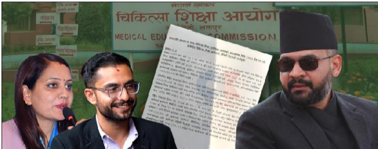
सिफारिस गरेको थियो । आयोगले तत्कालीन सुशीला कार्की नेतृत्वको सरकारलाई पत्र पठाउँदै एमबीबीएस अध्ययनको व्यवस्था मिलाउन भन्दै पत्र पठाएको थियो ।

काठमाडौं / प्रधानमन्त्री बालेन्द्र शाहले स्वार्थ बाधिएको भन्दै श्रम, रोजगार तथा सामाजिक सुरक्षा मन्त्री दीपककुमार साहलाई विद्दीवार पदमुक्त गरे । साहले पद रूपायोग गर्दै आउँदै श्रीमतीलाई स्वास्थ्य बीमा बोर्डमा सदस्य बनाएको आरोपपछि उनलाई पदबाट हटाइएको हो । बोर्ड सदस्य बनाउँदा सम्बन्धित स्वास्थ्य मन्त्रालयले ध्यान नदिएको भन्दै मन्त्री निशा मेहतामाथि पनि सचेत गराएको छ ।