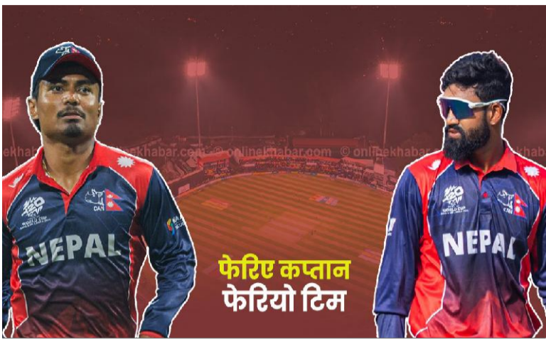
फेरिए कप्तान फेरियो टिम