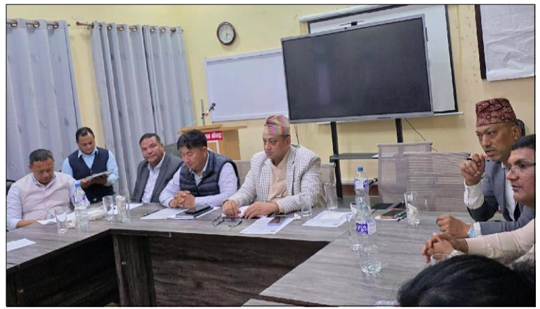
साझाकुरा संवाददाता हेटौडा, २२ वैशाख/